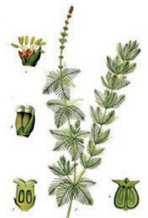
Pl. DS. Myriophyllum en épi. Myriophyllum spicatum L.